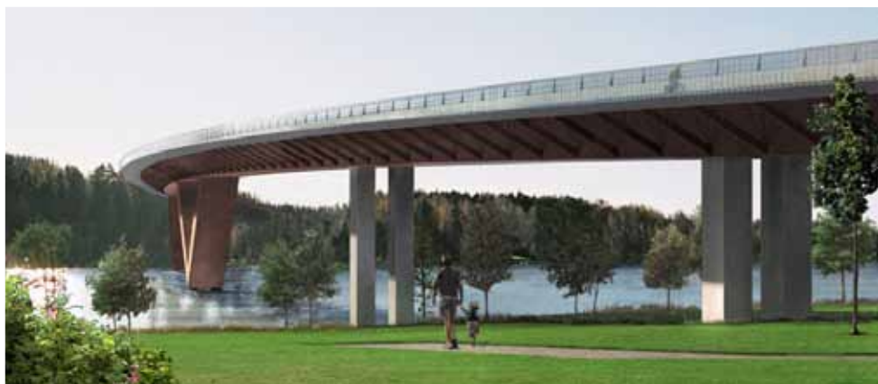
Vy från parken vid norra brofästet. Bilden är ett montage.