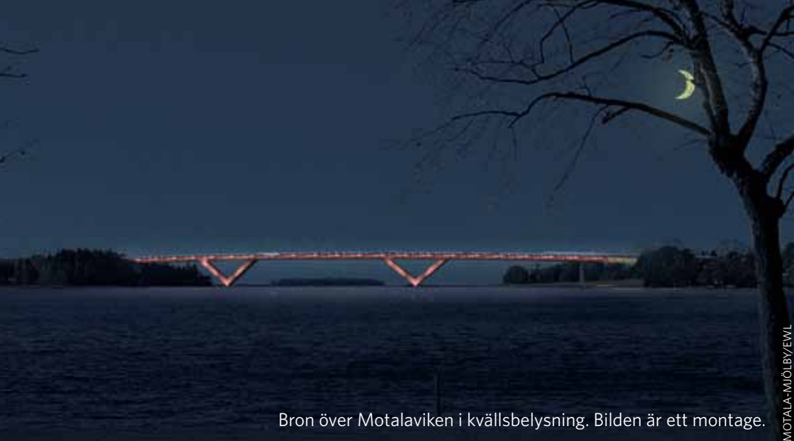
Bron över Motalaviken i kvällsbelysning. Bilden är ett montage.